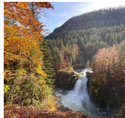
Saut du Doubs