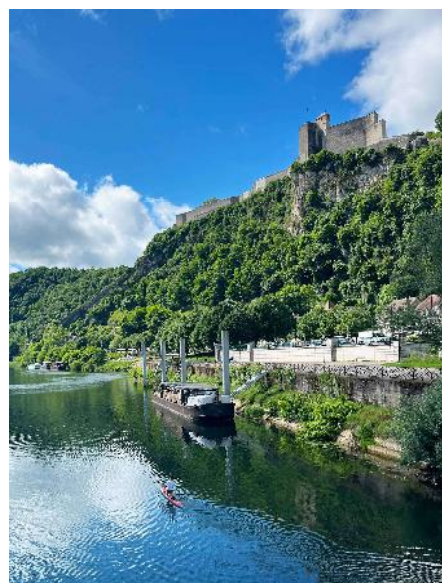
Besançon Doubs & Citadelle