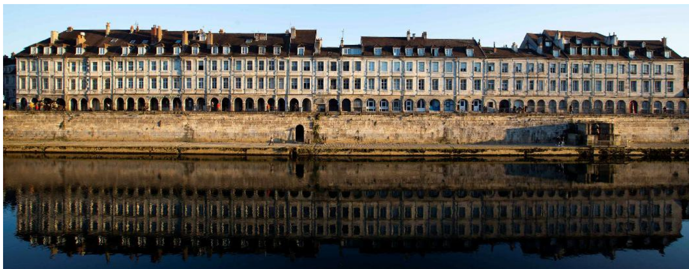
Besançon La Boucle