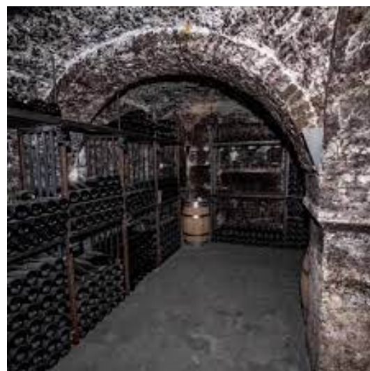
Namur – Caves de conservation sous la cathédrale

À la fin de cette première visite, nous avons repris les voitures pour rejoindre les caves de conservation situées sous la cathédrale Saint-Aubain et le Palais de justice (500 mètres de couloirs). Celles-ci se sont révélées être un véritable labyrinthe au sein duquel il est possible de trouver de nombreuses variétés de vins émanant de