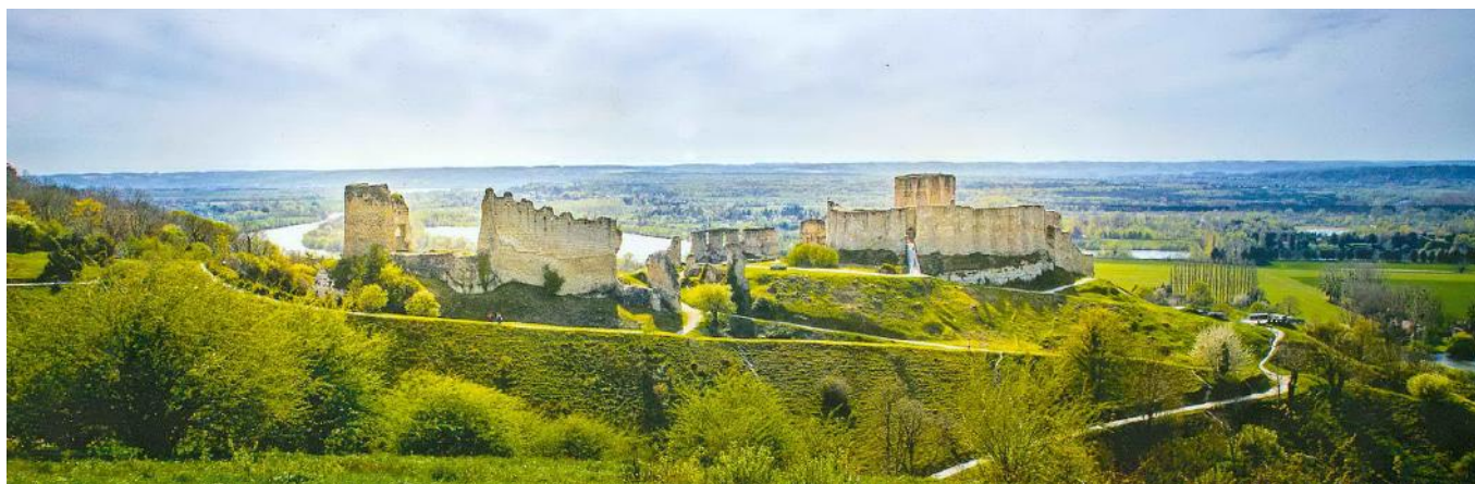
Les Andelys – Château Gaillard

Le programme détaillé a été publié dans le Bulletin n° 155 de décembre 2019 (disponible sur notre site).