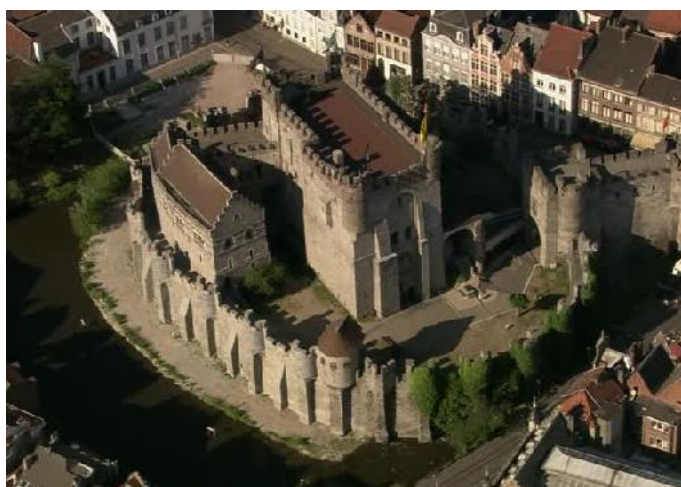
Gand – Château des Comtes

Voyage en car « Grand tourisme » (49 places).