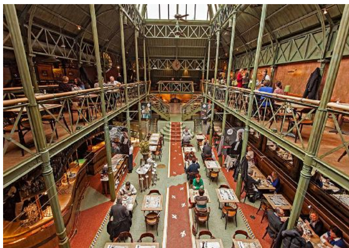
Gand – Restaurant « Pakhuis »