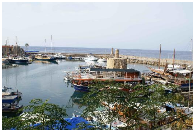
Girne – Port

Autre perle du nord, Girne (Kyrenia en grec), une charmante ville côtière dominée par un énorme château qui a succédé à un fort romain, remanié par tous les occupants successifs de l'île. Tristement célèbre, ce château a souvent servi de prison. Des Byzantins aux Britanniques tous les maîtres de l'île y ont incarcéré leurs adversaires. C'est ainsi que, sous la domination britannique, les combattants de l'EOKA qui luttèrent pour l'indépendance de Chypre y furent incarcérés, dans les années 50.