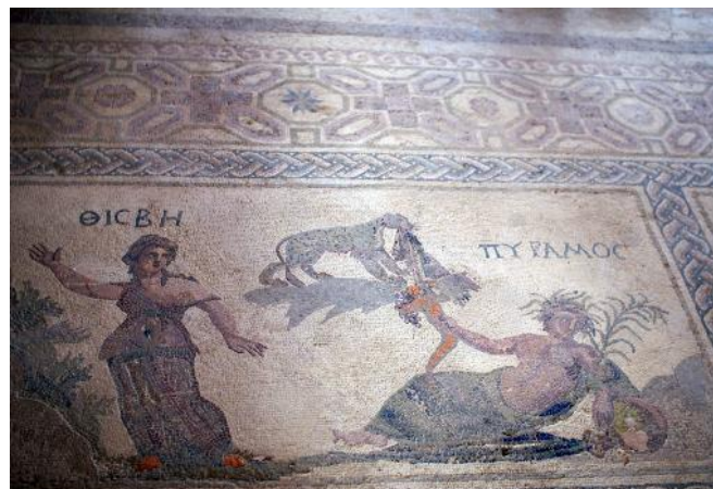
Pafos – Mosaïque

Au sud également se dresse la remarquable cité de Kourion , ville fondée vers le 13 e siècle avant Jésus-Christ, malheureusement détruite par un tremblement de terre en 365. On y trouve des vestiges datant de l'époque grecque et de l'époque romaine dont un magnifique théâtre qui, juché sur une falaise, domine la Méditerranée.