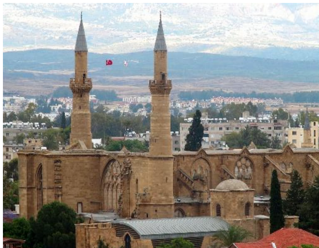
Nicosie – Mosquée Selimiye

La partie grecque de la capitale compte moins de monuments spectaculaires... si ce n'est une statue de Mgr Makarios III, père de l'indépendance, digne des colosses de Memnon !