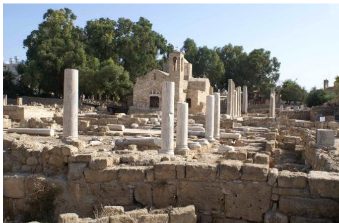
Pafos – Ruines basilique romaine

Totalement oubliées, elles ont été redécouvertes, par hasard, en 1962 quand on voulut égaliser le terrain !