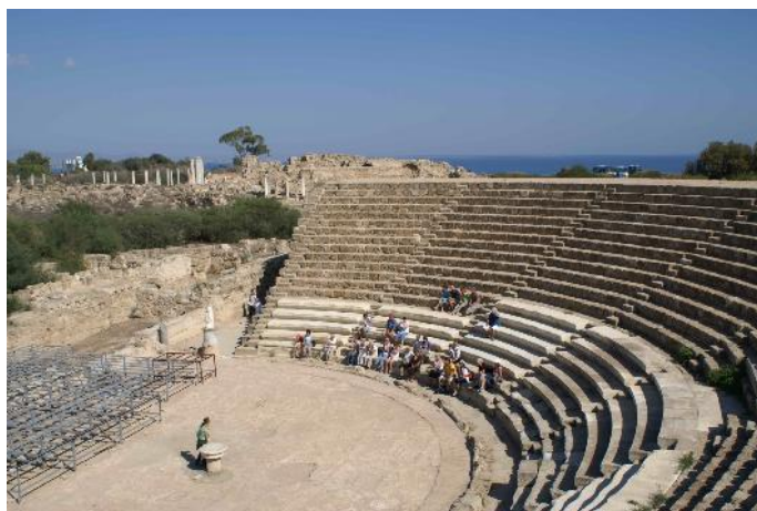
Salamis – Théâtre

Salamis domine la fabuleuse baie de Famagusta et dispute à Kourion le titre de plus beau site archéologique de l'île. La cité a compté jusque 100 000 habitants. Elle devint capitale de Chypre en 395 sous le nom de Constantia . Elle fut ravagée par un tremblement de terre puis rayée de la carte par l'invasion arabe de 647. Les ruines actuelles datent des époques grecques, romaines et byzantines. On peut y découvrir le monastère de saint Barnabas (ou saint Barnabé), compagnon de l'apôtre Paul lors de sa mission à Chypre en 45. Ce monastère a été transformé en musée après la guerre de 1974 et le départ du dernier moine.