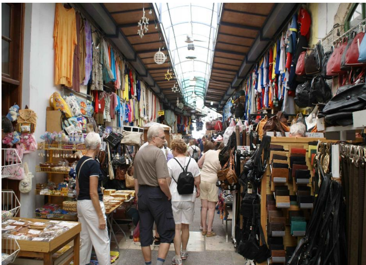
Pafos – Anciens souks, devenus « Marché municipal »