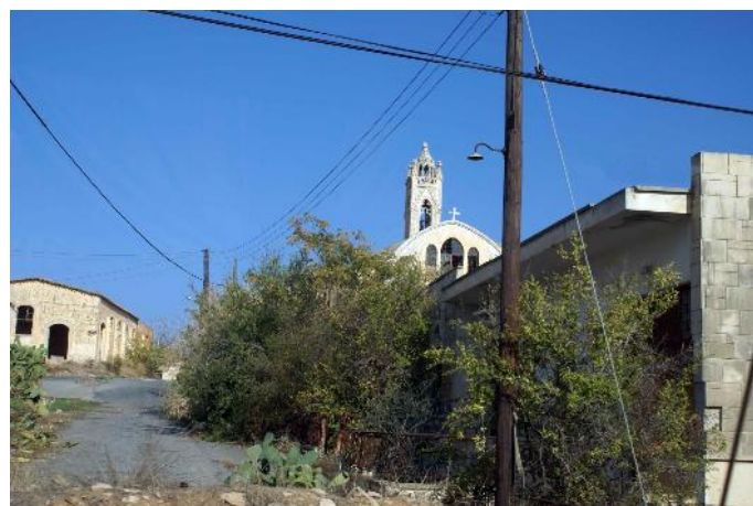
Famagousta – Zone balnéaire

L'ancienne zone hôtelière, elle, dort tristement, entourée de barbelés et interdite à tout visiteur !