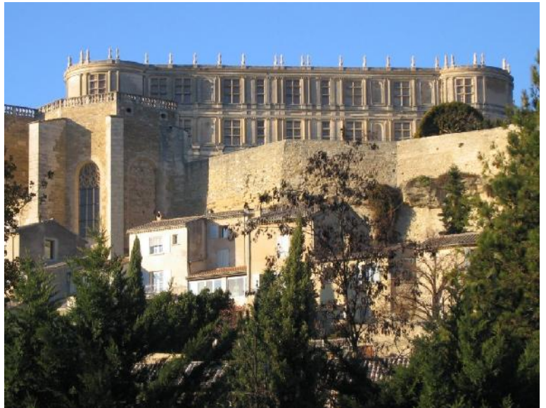
Château de Grignan