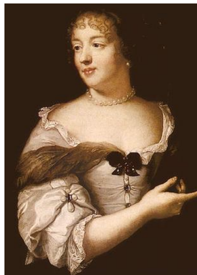
Marie DE RABUTIN-CHANTAL Madame DE SÉVIGNÉ

Plusieurs raisons expliquent l'intérêt que l'on a porté aux lettres de Madame de Sévigné.