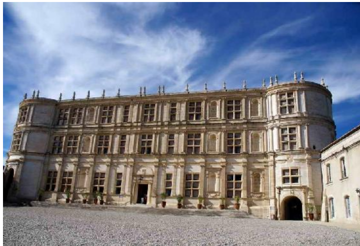
Le château de Grignan