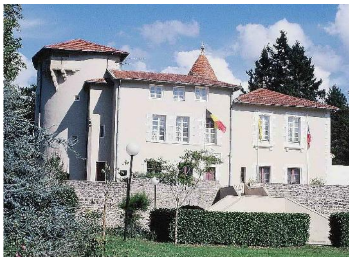
Le château de Collonges

Les chambres du château étaient certes assez spartiatement équipées, mais il en eût fallu plus pour décourager les membres du groupe qui apprécièrent, par ailleurs, les appétissants repas qui leur furent servis et l'ambiance du bar proposant un large choix de boissons, dont des trésors régionaux que