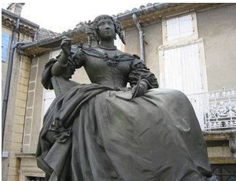
Madame DE SÉVIGNÉ à Grignan